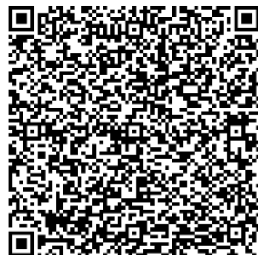
Vivien Pracejus Schulbeauftragte für Studien- und Berufsorientierung